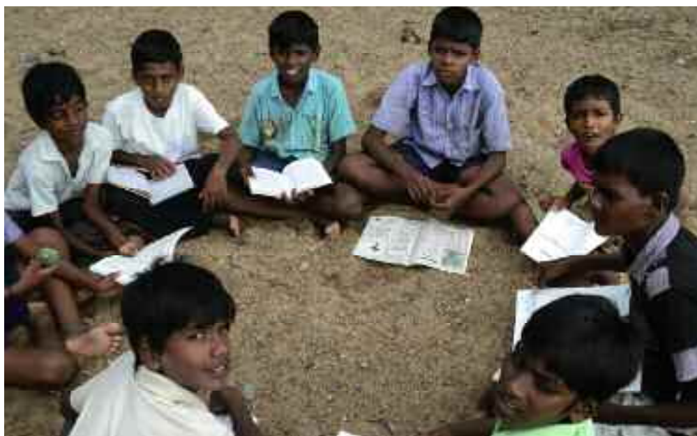
Bildung ist die einzige Möglichkeit, um der Armut zu entkommen. Deshalb bringen viele Eltern große Opfer um ihren Kindern eine gute Ausbildung zu ermöglichen.