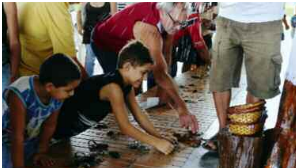
Segnung der Autoschlüssel. Es sieht ein wenig spektakulär aus, doch dahinter steckt die Frömmigkeit vieler Brasilianer, die auf Gottes Hilfe vertrauen.