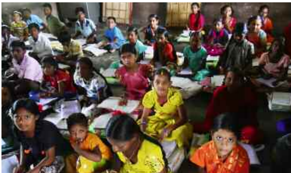
Indien verzeichnet den höchsten absoluten Bevölkerungszuwachs aller Länder der Erde. Nach Schätzungen der Vereinten Nationen wird Indien 2045 China als bevölkerungsreichsten Staat ablösen.

Nach vielen Anfangsschwierigkeiten haben wir nun 28 Priester, zwölf Mitbrüder mit Ewigen Gelübden, 36 mit zeitlichen und acht Novizen. Ich bin der einzige Ausländer