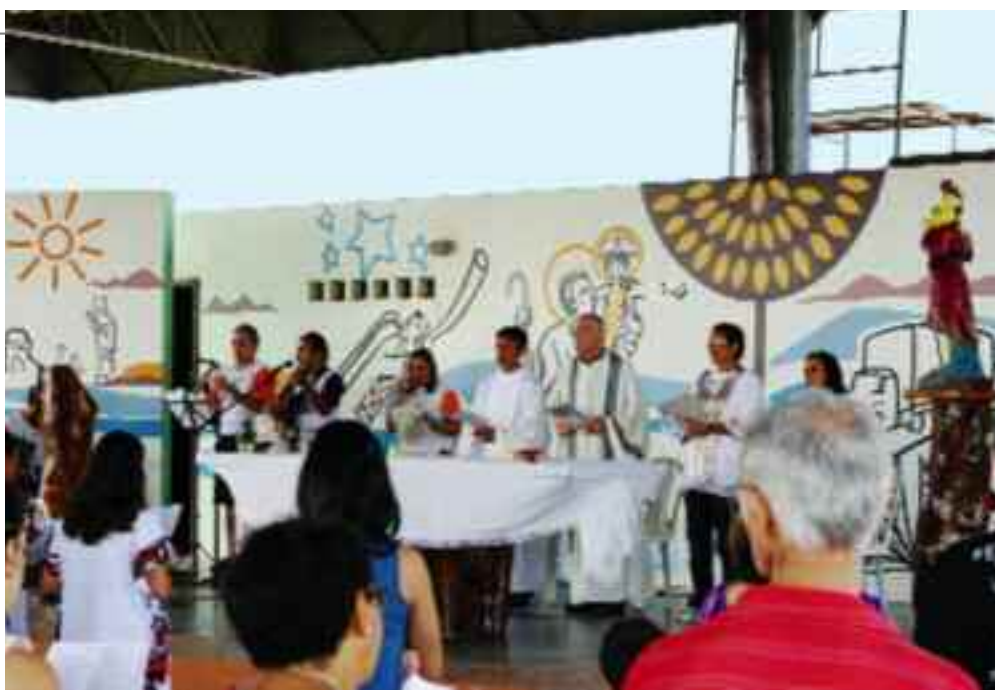
Messfeier in der Christophorus-Kirche. Fernfahrer aus ganz Brasilien kennen und schätzen diesen Treffpunkt. Die Kirche ist auch der Ort, wo sie den Rosenkranz beten, ihre Anliegen in ein bereitliegendes Buch einschreiben, zu einem Seelsorgsgespräch kommen oder ihre Kinder taufen lassen.

Schon aus diesem Grund war und ist die Christophorus-Autobahnkirche in Fortaleza mittlerweile in ganz Brasilien bekannt. Die Fern-